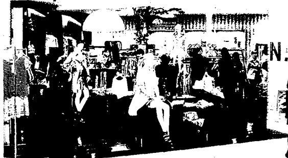
「エヌ ナチュラルビューティーベーシック」の各店舗は白いレンガ風の壁とウッドフロアリング、フッドシェルフで明るく、落ち着いた内装になっている